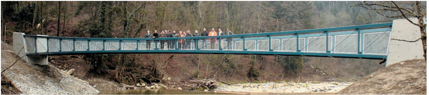
Die Schifflibrücke über der Sihl, links während des Aufbaus über einem Montagegerüst, rechts, während der Schlussabnahme.

kropfählen fundiert, wobei die flussseitigen Pfähle (10 m) auf Druck und die landseitigen Pfähle (6 m) auf Zug beansprucht sind.